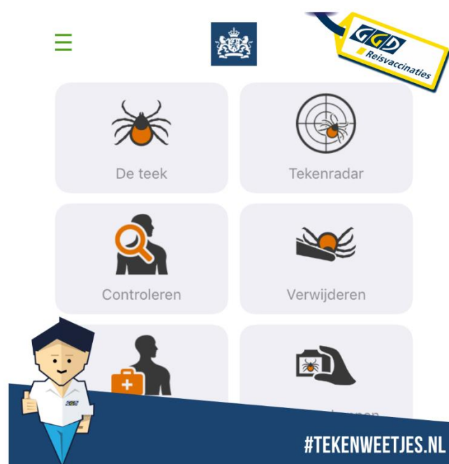
Figuur 1. Download de gratis app Tekenbeet van het RIVM.

Informatie over de ziekte van Lyme, TBE en de app Tekenbeet vind je op www.tekenweetjes.nl